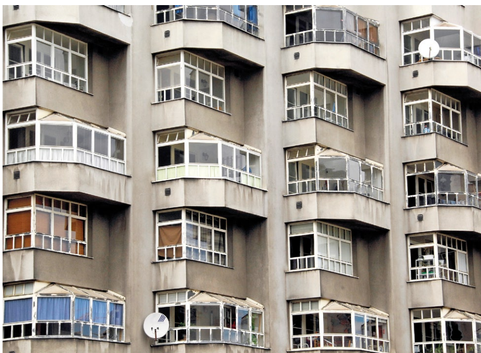
Hässliche Häuser gibt es viele. Welches ist für Sie das scheusslichste?

Was hässlich und was wunderhübsch ist - darüber lässt sich natürlich streiten. Und dieses Streitgespräch werden wir online austragen: Wir suchen die 500 schlimmsten architektonischen Verbrechen